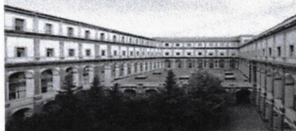
Largo Santi Apostoli, n°8/A - 80138 Napoli

sito web: www.liceoartisticonapoli.it ; tel.: 081457960